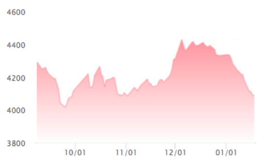
Indeks stali walcowanej na gorąco

Stal zwyczajna w zwojach- Stal benxi wczoraj 10:25 Stal zwyczajna w zwojach- Stan Yan wczoraj 10:25 5.75*1500*C (bez zmian) 4100 5.75*1500*C (bez zmian) 4090 Stal zwyczajna w zwojach- Stal An gang wczoraj 10:25 Stal zwyczajna w zwojach- Stan Sha gang wczoraj 10:25 5.75*1500*C (bez zmian)4100 5.75*1500*C (bez zmian)4100 Metal zwyczajny w zwoju- Metal Cang zhou wczoraj 10:25 Stal zwyczajna w zwojach- Stan Bao wczoraj 10:25 5.75*1500*C (bez zmian) 4090 5.75*1500*C (bez zmian)4100